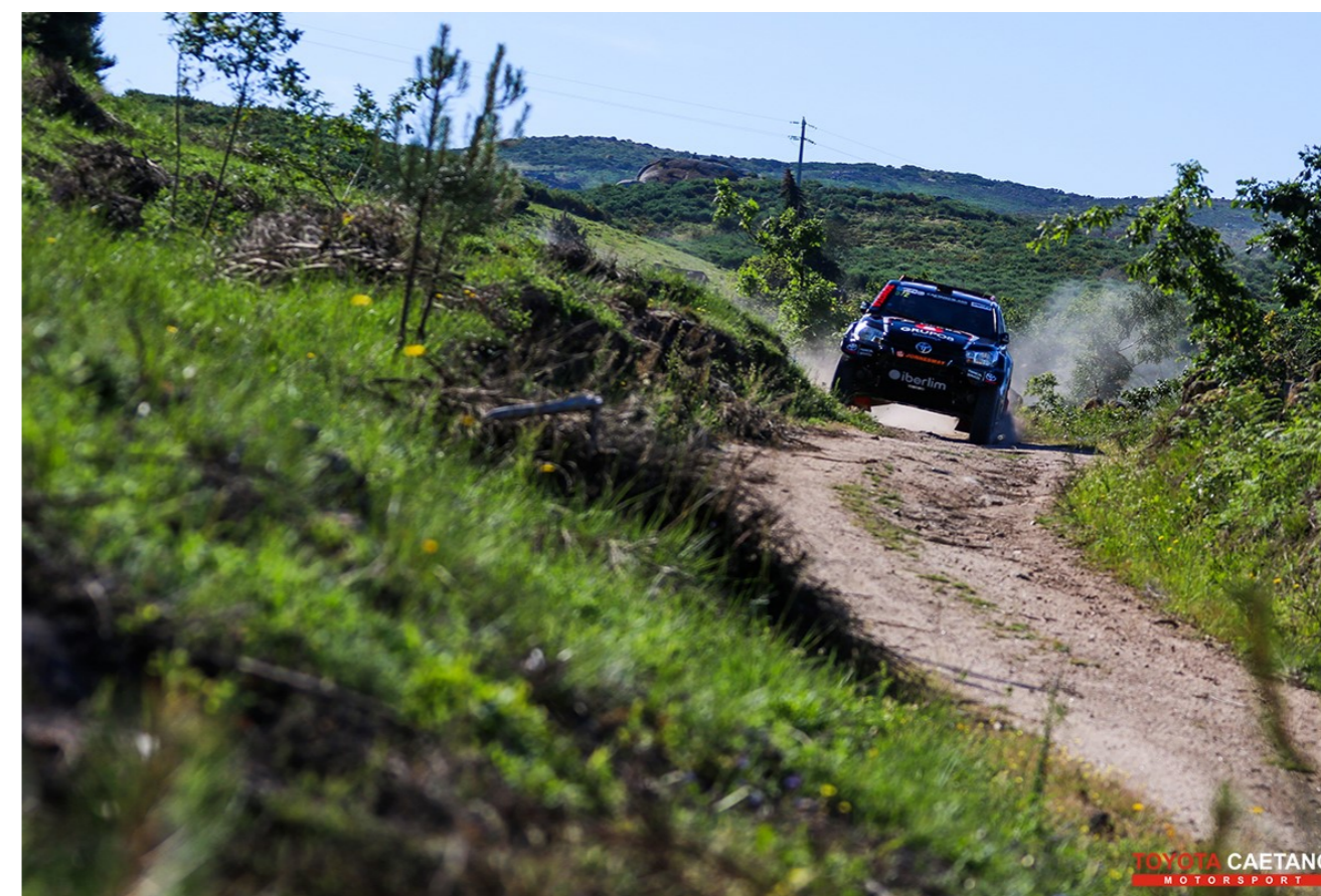
TÓNIA CAETANO MOTORSPORT

Conheça um pouco mais da historia do Município de Baião em www.cm-baião.pt